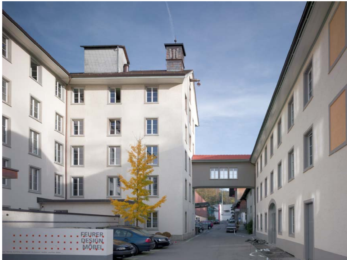
links Spinnereigebäude mit Besucherparkplatz, rechts Bürogebäude

Trümppler AG, Aathalstrasse 84, 8610 Uster Tel. 044 941 85 00, Fax 044 941 85 54