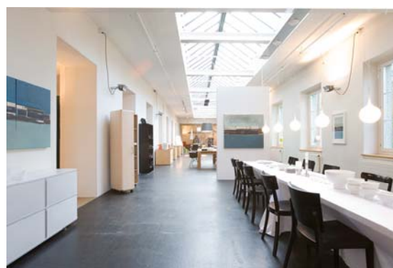
Verkaufslokal EG Spinnerei